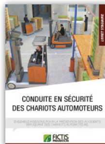
Livret Conduite en sécurité des chariots automoteurs