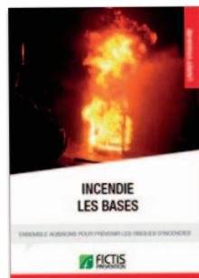
Livret «Incendie : les bases»